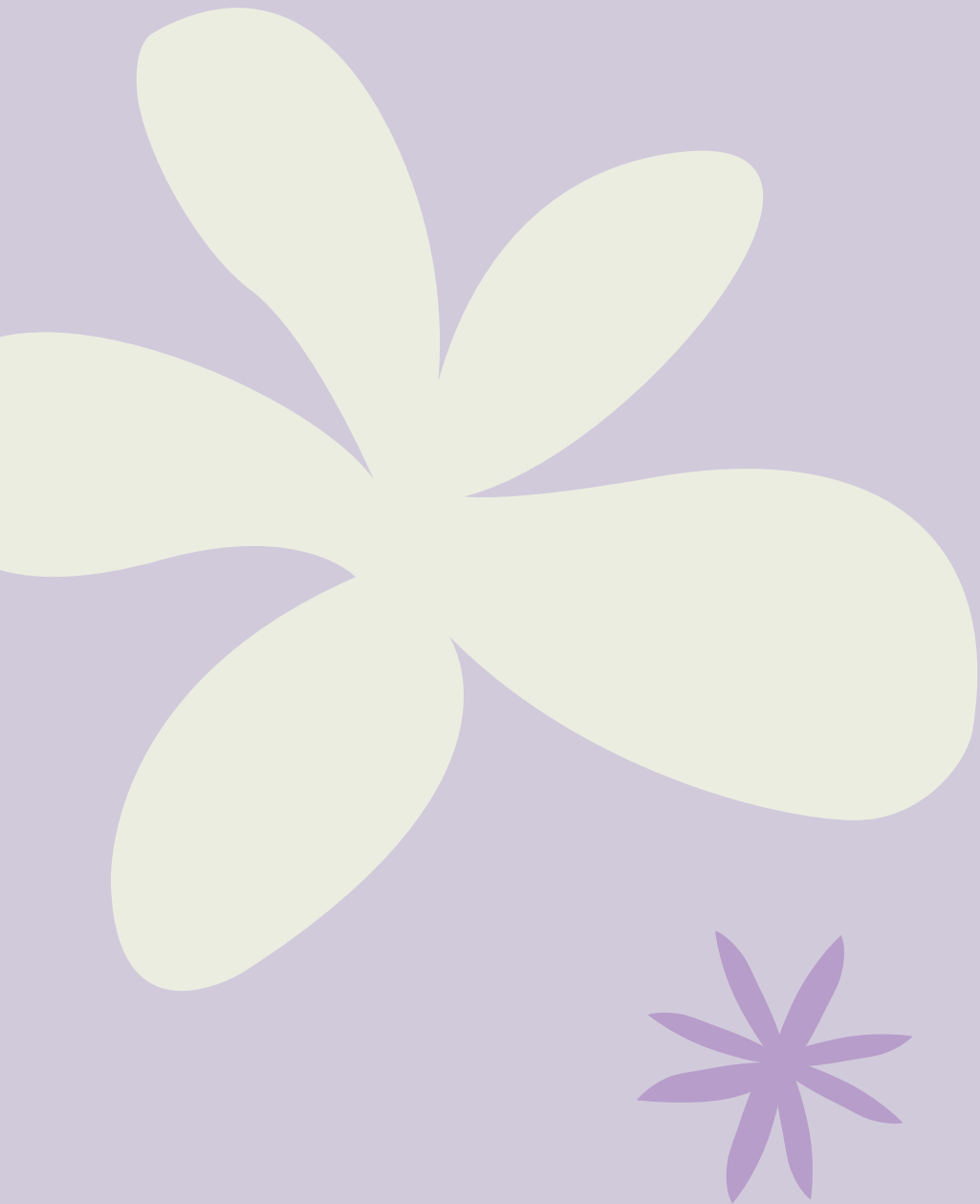
ILLUSTRATION & DESIGN ALEXANDRA DE ASSUNÇÃO

IMPRIMÉ EN 2023 L'HUILLEUR _ 123, RUE D'UCKANGE B.P. 80056 - 57192 FLORANGE CEDEX