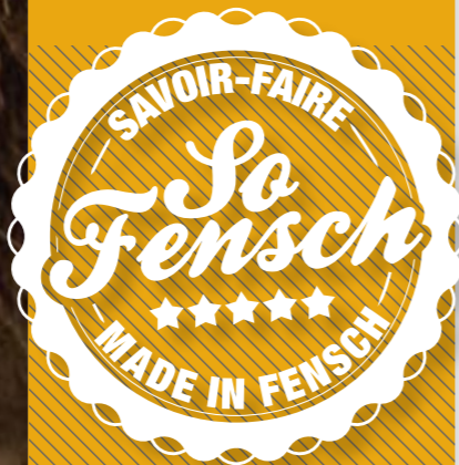
Ferme des hauts de Fensch, Neufchef

Au total, le label territoire regroupe 23 artisans et désormais une trentaine de produits différents, à retrouver sur www.agglo-valdefensch.fr .