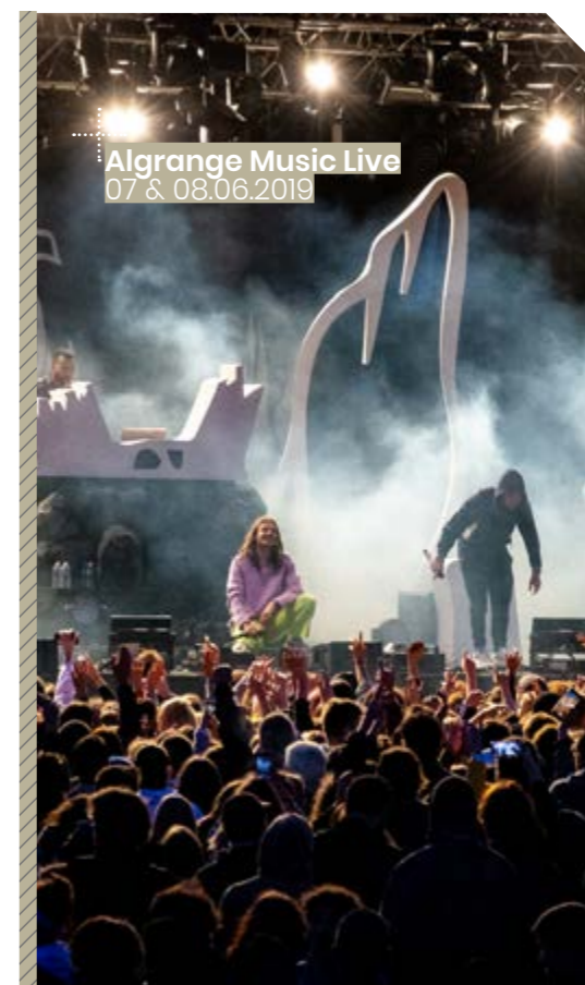
Algrange Music Live 07 & 08.06.2019