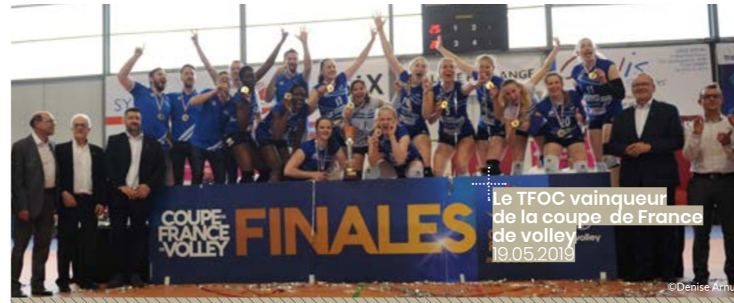
Le TFOC vainqueur de la coupe de France de volley 19.05.2019