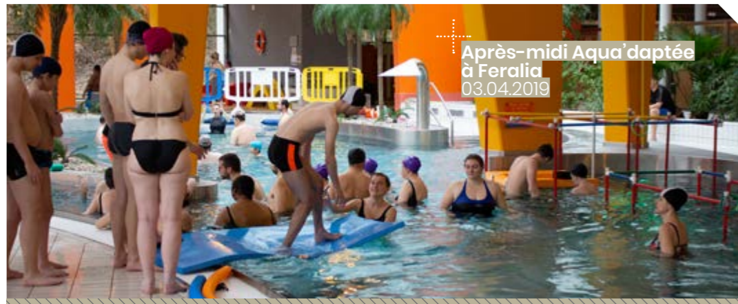
Après-midi Aqua'daptée à Ferialia 03.04.2019