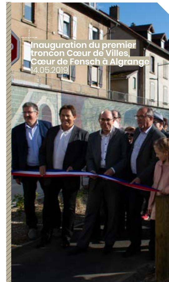
Inauguration du premier tronçon Cœur de Villes, Cœur de Fensch à Algrange 14.05.2019