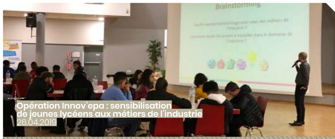
Opération Innov'epa : sensibilisation de jeunes lycéens aux métiers de l'industrie 26.04.2019