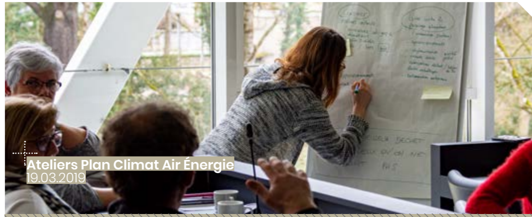
Ateliers Plan Climat Air Énergie 19.03.2019