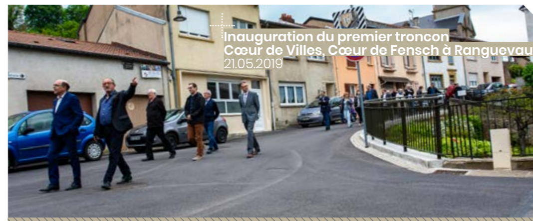
Inauguration du premier tronçon Cœur de Villes, Cœur de Fensch à Ranguevaux 21.05.2019