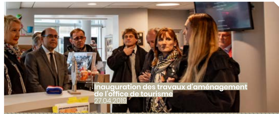
Inauguration des travaux d'aménagement de l'office de tourisme 27.04.2019