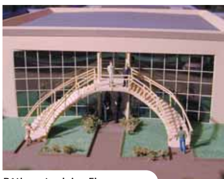
Bâtiment relais - Florange

Résolument orientée vers une politique de développement économique de la vallée de la Fensch et par voie de conséquence vers la création d'emplois, la Communauté d'Agglomération a décidé d'accompagner et de soutenir toutes les nouvelles entreprises qui viendront s'implanter sur son territoire.