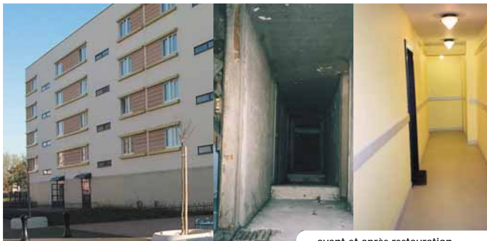
avant et après restauration

Les politiques de développement social et urbain menées sur les quartiers Ouest à Uckange, Remelange à Fameck, Saint-Nicolas