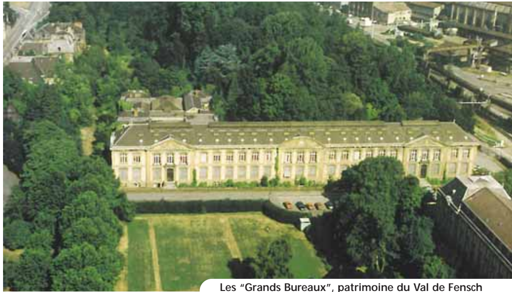
Les "Grands Bureaux", patrimoine du Val de Fensch