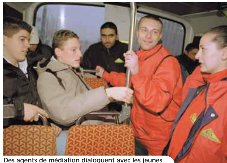
Des agents de médiation dialoguent avec les jeunes et assurent la sécurité

Organiser les déplacements actuels et proposer des stratégies améliorant la qualité de vie sont ses objectifs.