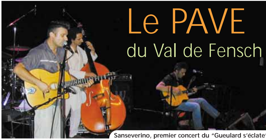
Sanseverino, premier concert du "Gueulard s'éclate"

Développer une politique d'action culturelle sur son territoire est aussi une des volontés chères à la Communauté d'Agglomération.