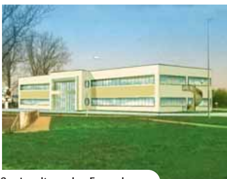
Centre d'appels - Fameck

Pour une surface totale de 2000 m 2 , ce bâtiment est composé de 6 cellules de différentes superficies dont certaines sont d'ores et déjà réservées.