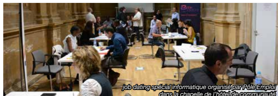
job dating spécial informatique organisé par Pôle Emploi dans la chapelle de l'hôtel de communauté

Le secteur Entreprise de l'agence de Hayange, ce sont également des événements organisés tout au long de l'année pour informer ou favoriser les recrutements. La Communauté d'Agglomération du Val de Fensch a notamment accueilli cette année deux job dating, axés respectivement sur la vente à domicile indépendante et l'informatique. En tout, une dizaine de manifestations (salon jeune d'avenir, job dating, rencontre pour l'emploi ou recrutement à l'agence) a été programmée en 2016. Le travail quotidien de l'équipe Secteur Entreprise a été accueilli favorablement, la satisfaction des entreprises ayant augmenté de 20 points depuis 2015.