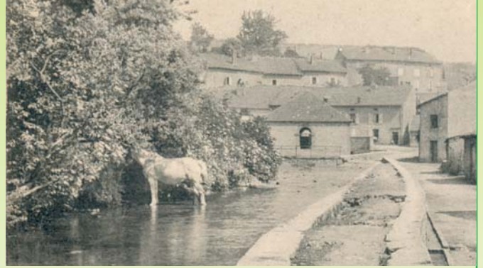
Collection M. Grussin, adhérent AD Fontes